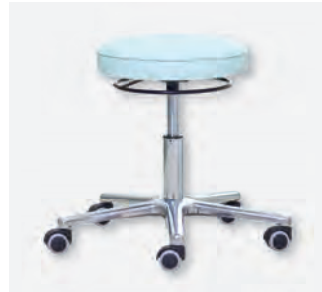
2 DH-2000/RA (weiche Doppelrollen)