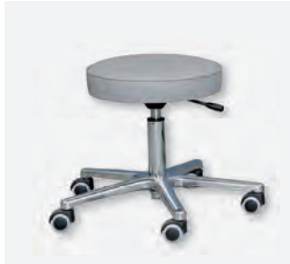
1 DH-2000 (weiche Doppelrollen)

Die Drehhocker, Drehstühle, Bürostühle und Hocker sind unentbehrliche Hilfsmittel in jeder Arztpraxis. Um den Anwendern bzw. Patienten eine bequeme Sitzstellung zu gewährleisten, lassen sich die Drehhocker stufenlos in der Höhe (per Fuß- oder Handauslösung) verstellen.