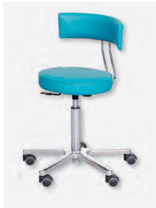
2 DS-2000/RLLG (weiche Doppelrollen)