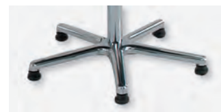
5 Fußkreuz mit Gleitern