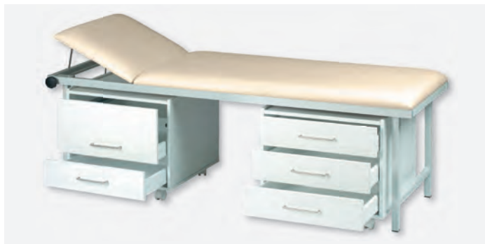
1 SW-470/2, SW-470/3, U-1065

Die Schränke, Schrank- und Vielzweckwagen sind unentbehrliche Helfer in jeder ärztlichen oder medizinischen Praxiseinrichtung, da sie als mobile Ablage eingesetzt werden können. Die Korpusse und die Schrankblenden bestehen aus weißen 16 mm starken melaminbeschichteten Platten.